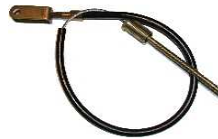
Cable embrayage Réf 30006 € 36,90