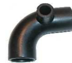
Durite inférieure Partie haute depuis O7/63 Réf 110281 € 35,90