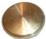
Bouchon radiateur Réf 10235 € 28,40