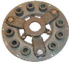
Mécanisme embrayage échange standard Réf 30004 € 255,20