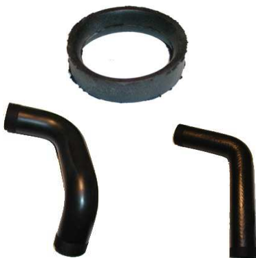
Raccord caoutchouc entre Pompe à eau et culasse Réf 110285 € 5,90