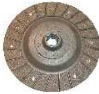
Disque embrayage échange standard Réf 30005 € 93