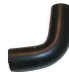
Durite inférieure Partie basse depuis O7/63 Réf 110282 € 13,50