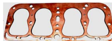
FORD AF Réf 170720 €140