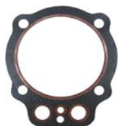
TERROT 500 €35